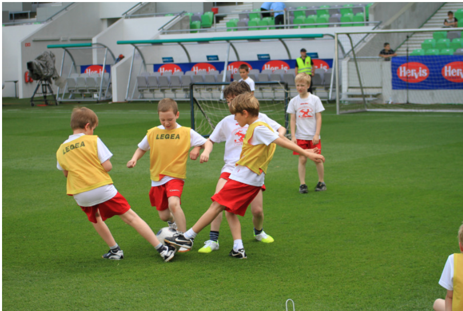
Slika 6: Nogometni programi do 13. leta starosti.

Za razvoj nogometa niso odgovorni le veliki klubi z odličnimi pogoji dela. Obstoj manjših klubov je pomemben iz vidika vključevanja otrok v nogomet in prav veliko število malih klubov v posameznem okolju omogoča vključevanje otrok na večjem območju in s tem večjo verjetnost, da se bo v posamezni generaciji našel vrhunski posameznik. Zato je potrebno ozavestiti bolj organizirane klube in nogometne centre, da spodbujajo obstoj in delo manjših klubov, od koder bi tudi sami lahko