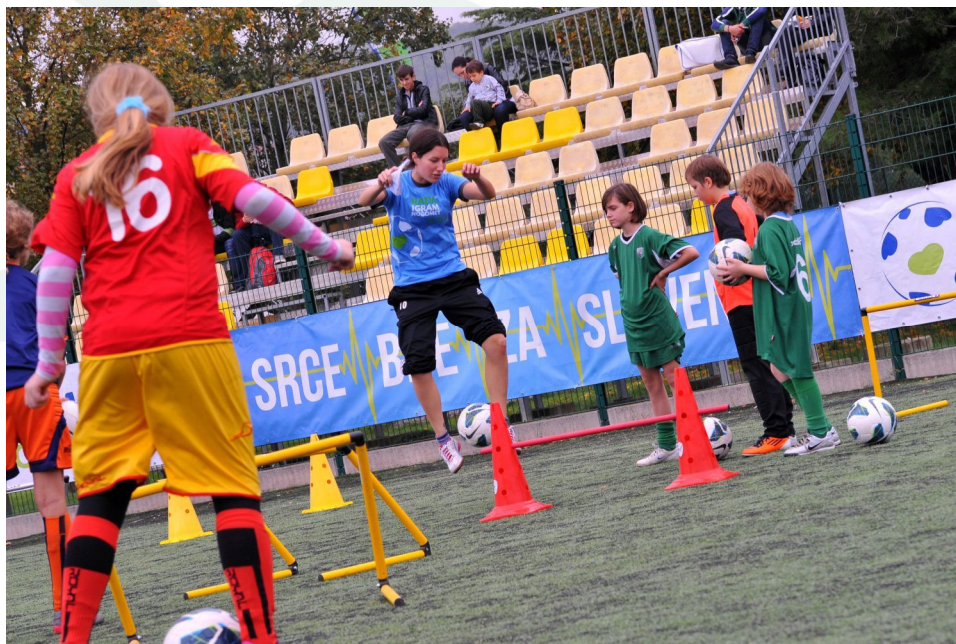
Slika 11: Projekt 'Rada igrat nogomet, in ti?'