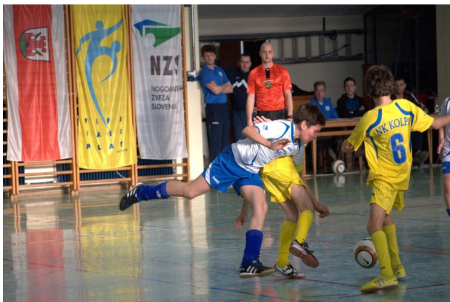
Slika 7: Dvoranski nogomet.

Finalna oziroma zaključna prireditev zimskega igranja pa predstavlja praznik nogometa za najmlajše nogometaše iz celotne Slovenije, ki je namenjena tudi druženju in navezovanju novih medvrstniških stikov.