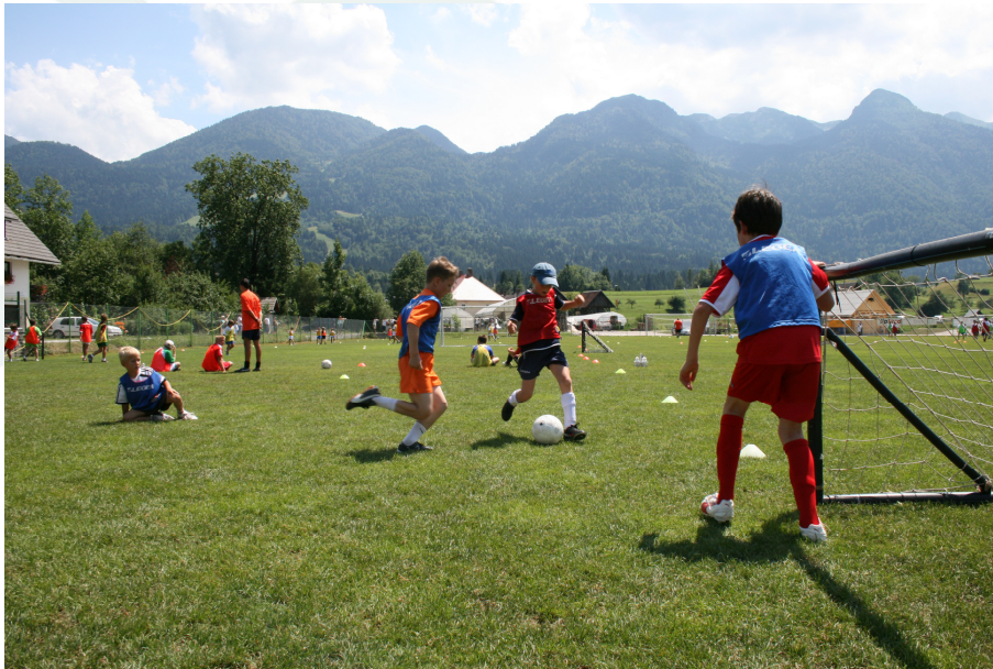
Slika 9: Nogometne počitnice in tabori.