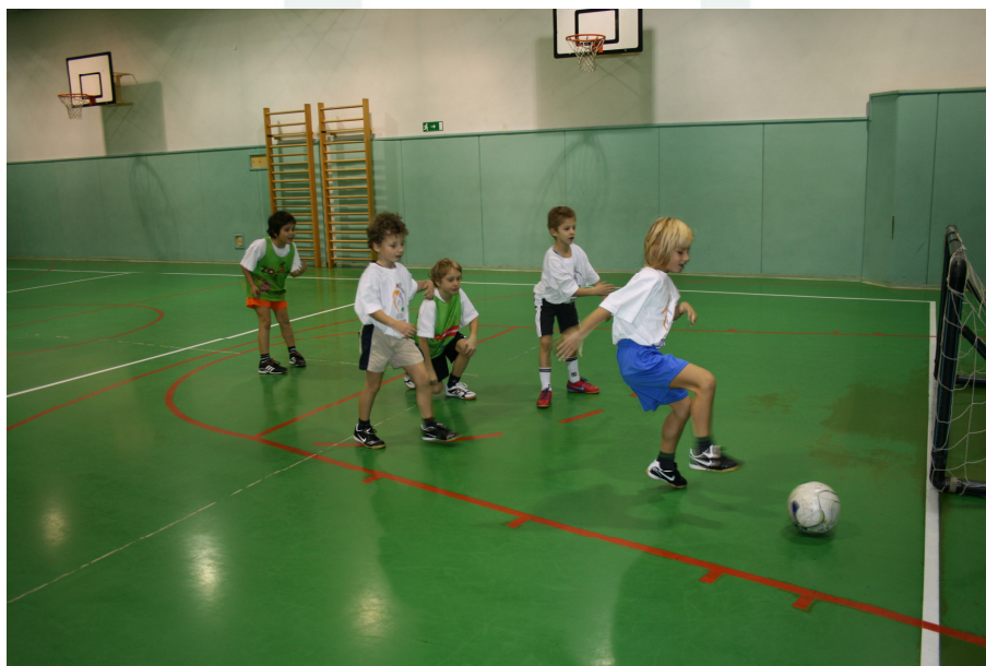
Slika 5: Otroške nogometne šole.

V Sloveniji se je že v preteklih letih v klubskih sredinah pojavil interes povezovanja in sodelovanja s šolskim sistemom. Več klubov se je povežalo z okoliškimi šolami in znotraj mladinskega programa postavilo vsebinski del, ki je obravnaval ONŠ. Takšni klubi z dvoletnim programom v šolah poskušajo navdušiti čim več otrok za kasnejši vpis v nogometni klub in redno treniranje. S tem smo dobili voden proces vključevanja otrok v nogomet in si zagotovili množičnost, ki je osnovni pogoj za obstoj in kvaliteto. Preteklo obdobje je bilo zelo uspešno, saj smo uspeli vpeljati organizirano nogometno vadbo pod vodstvom nogometnih strokovnjakov v 63 % slovenskih osnovnih šol za okoli 5.500 otrok. V naslednjem štiriletnem obdobju bi želeli ta odstotek in število otrok še povečati, čeprav je največji cilj predvsem končni rezultat športnega programa po šolah, ki ga predstavlja množični vpis v klubske športne programe ter zagotavljanje novih nogometašev.