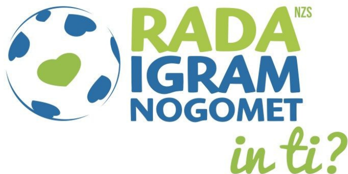
Slika 10: Blagovna znamka 'Rada igram nogomet, in ti?'

Sistematično vključevanje, dobra promocija, kakovostno strokovno delo, projektni programi in izobraževanje vseh deležnikov v naslednjem obdobju bodo najpomembnejši koraki, ki bodo vodili k množičnosti, rezultat pa bo viden v: