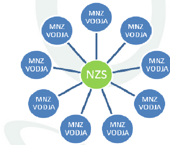
Slika 3: Organizacijska povezanost med MNZ in NZS.

Področni organizatorji so tesno povezani z oddelkom, odgovornim za področje nogometa za vse na NZS. Uresničujejo dogovorjene programe ter poročajo o opravljenem delu in stanju na terenu. Izvajajo vnaprej dogovorjene vsebine, na svojem področju prepoznajo priložnosti ali spodbude za nove vsebine, značilne samo za tisto področje, ali pa skupaj s tehnično službo izboljšujejo letne programe za vse MNZ. Njihova naloga je predvsem organizacijska, včasih pa tudi praktična na terenu. Predvsem pa morajo biti strokovno usposobljen kader, ki je postavljen s strani NZS in ima pregled ter kontrolo nad vsebino Nogometa za vse na posameznem področju.