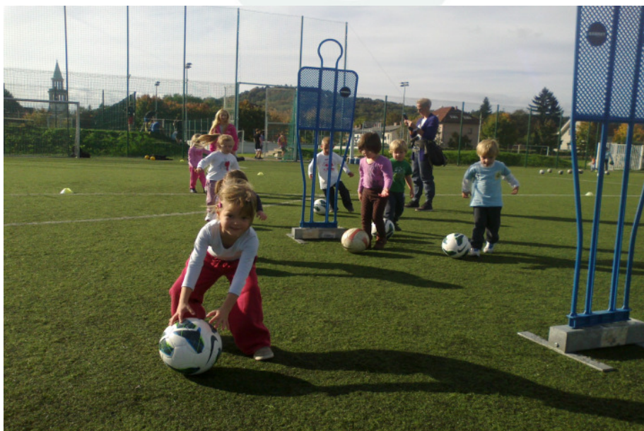
Slika 4: Nogomet v vrtcih.

Program je ob koristnosti za otrokov razvoj in zorenje pomemben zaradi prepoznavnosti nogometa v določenem okolju, kar je odlična popotnica za vse ostale programe v kasnejših starostnih kategorijah. Pomaga pri uspešnosti vpisa otrok v ONŠ in je zato program, s katerim bomo lahko uresničevali rast registriranih nogometašev, ki je pomemben pokazatelj uspešnosti Nogometa za vse.