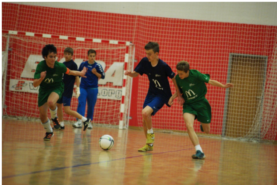
Slika 8: Šolska športna tekmovanja.